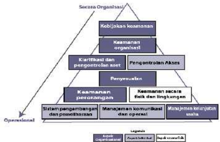
Gambar 2.1 Struktur Sistem Kendali (Nancy Keene:2005:67)